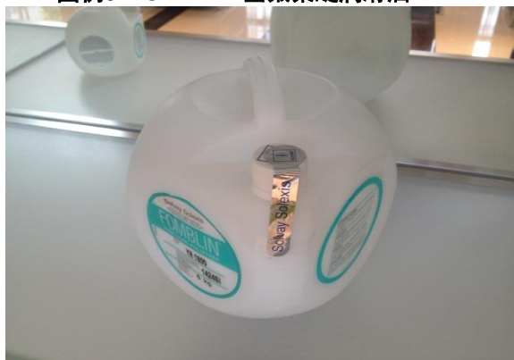
图例：FOMBLIN 全氟聚醚润滑油