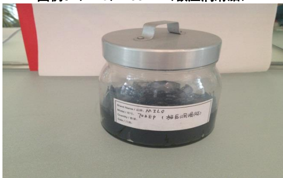
图例：(Milo) 703EP (极压润滑脂)

该系列润滑脂适用于机车车辆制动缸的润滑，铁路机车牵引电机轴承的润滑，以及铁路轮轨润滑。